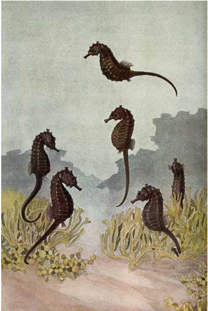
Der japanische Maler und Illustrator Hashime Murayama stellte in seinen Arbeiten gern auch die Umgebung der Lebewesen dar, die er malte, wie hier in Sechs Seepferde im Meer aus 1920.